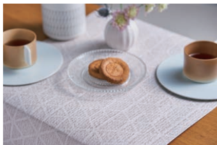
Table mat of paper

The water-repellent finish makes it ideal for table decorations for special guests.