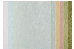
左から、白・水色・葉の花色・桃色・若葉色・松葉色