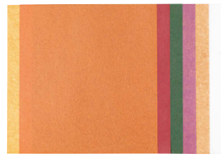
左から、カキ・ワイン・オリーブ・プラム・ブラウン・白